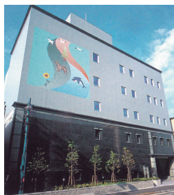
株式会社総合水研究所 本社